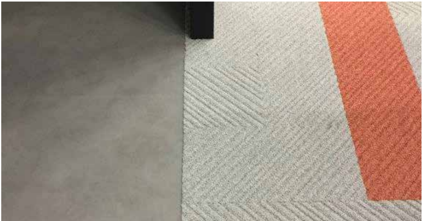
Objekt: ORGATEC 2016, Messestand Desso