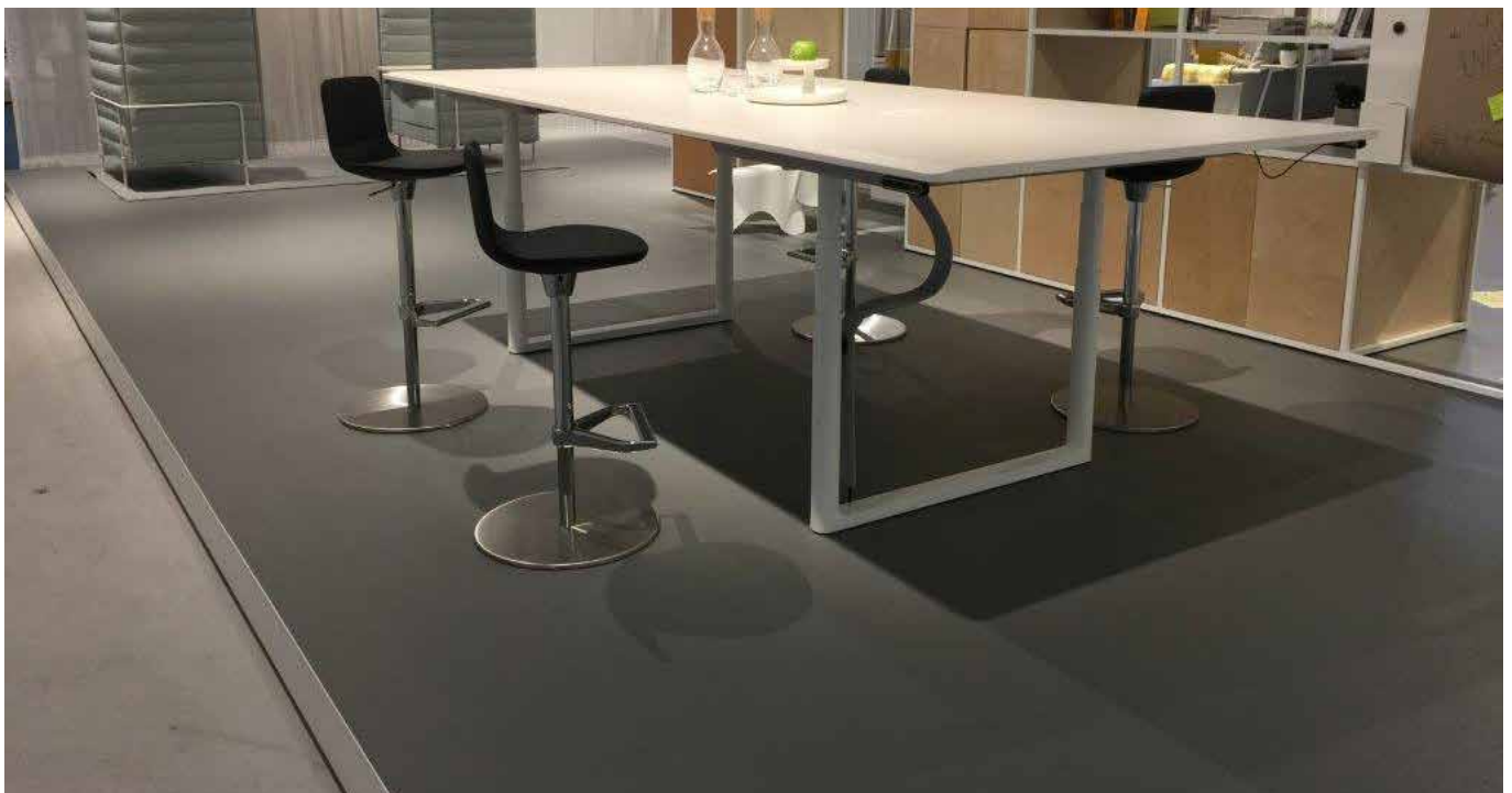
Objekt: ORGATEC 2016, Messestand vitra