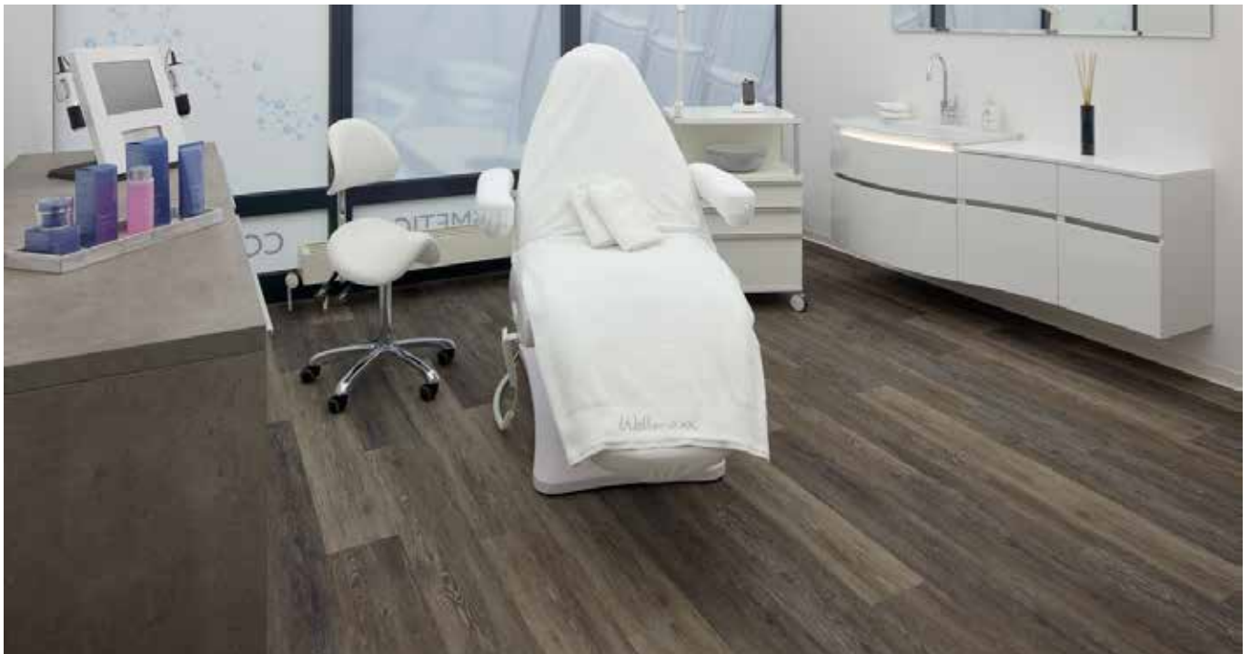
Objekt: Wellmaxx Sunpoint, Hürth