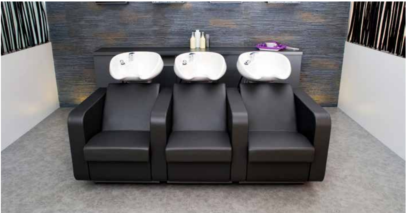
Objekt: Haarwerk Amel & Sievers, Dormagen