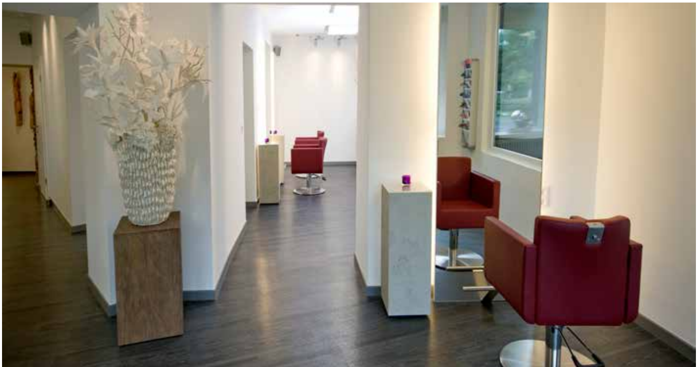
Objekt: Giacomo Hair & Make Up, Köln