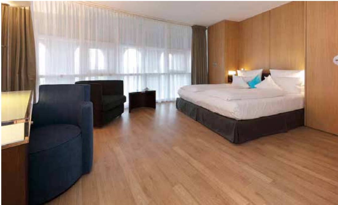
Die gekalkte Eiche aus der Kollektion Floors@work von Project Floors unterstreicht im Kölner Hotel im Wasserturm das warme Ambiente.

Wer an Köln denkt, denkt an den Dom. Dabei war ein 140 Jahre alter Wasserturm im Herzen der Stadt lange Zeit ein zweites Wahrzeichen der Rheinmetropole. 1990 wurde er umgebaut und beherbergt heute das „Hotel im Wasserturm“, ein 5-Sterne-Haus mit modernem, exklusiven Ambiente. Neben 88 Zimmern und Suiten verfügt es über einen Beauty- und Wellness-Bereich, zwei Restaurants mit gehobener, vorwiegend regionaler Küche sowie eine Dachterrasse, die in 35 m Höhe einen 360°-Panorama-Ausblick auf die Stadt erlaubt und das Wohlfühlpaket für den Gast abrundet.